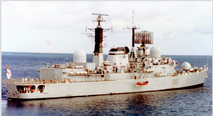
HMS Sheffield

Ddeuddydd yn ddiweddarach, ar 4 Mai, fe gafodd y llong Brydeinig HMS Sheffield ei tharo gan yr Archentwyr. Fe gafodd y llong ryfel fechan ei tharo yn yr ystafell reoli, ac aeth ar dân yn fuan wedyn. Cafodd 20 o forwyr Prydeinig eu lladd ac fe gafodd llawer o rai eraill eu llosgi'n ddifrifol. Roedd yr holl ddigwyddiad wedi cael ei ffilmio gan griwiau